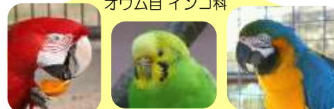
ベニコンゴウインコ セキセイインコ ルリコンゴウインコ