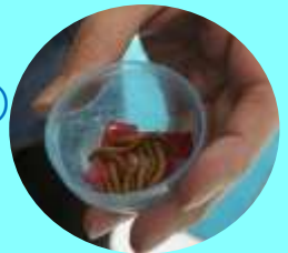
↑ミルワーム（虫） ※生きています

また、おやつ（1個100円） のミルワームは大好物で、 いつも皆で取り合いに なります。