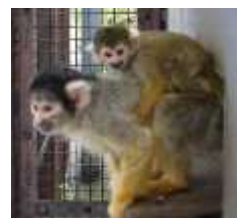
③母親の背中にしがみついて大きくなります。