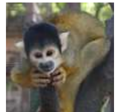
⑥2～4年で大人になります。