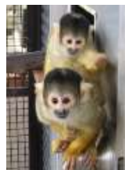
⑤約1年で独り立ち。子供同士で行動します。