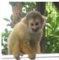
④約半年ほどで母親から離れ一人で遊ぶようになります。