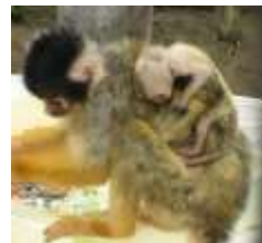
②1回の出産で1匹産みます。