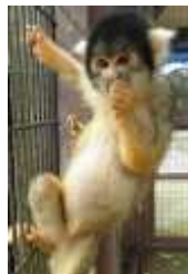
①妊娠期間は約4ヶ月間。