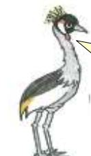
ホオジロカンムリツル