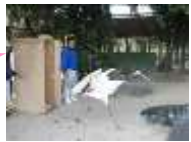
⑥いよいよタンヨとご対面。緊張の一瞬です。