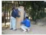
④鳥類センターに到着！タンヨの部屋へ運びます。