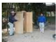
⑤輸送箱を開けて「出てもいいよ～」